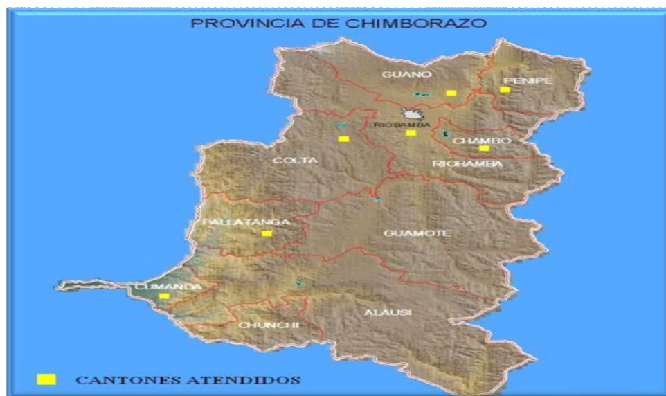
Gráfica 4. Cantones atendidos por las VRC

Los Cantones de la Provincia de Chimborazo y en especial el Cantón Penipe, en el cual ha incursionado VRC en sus inicios, ha sido históricamente relegados de servicios financieros, si bien existe una población considerable en todas las parroquias rurales de este Cantón (refiérase al gráfico 4 para su ubicación geográfica), éstas no han podido acceder a servicios financieros por la cantidad de documentos exigidos, además de los altos costos de transacción, lo cual ha ocasionado que no exista un flujo mayoritario de personas con experiencia crediticia. El difícil acceso a sectores rurales es otro factor que impide que las personas puedan mejorar su calidad de vida por todos los gastos que implica trasladarse de un lugar a otro sin tener los medios necesarios.