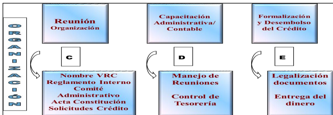
Gráfica 7. Constitución de una Ventanilla Rural Cooperativa

La comunidad es la garante solidaria de los créditos entregados, que tienen un monto igual para todos sus miembros. La ventanilla inicia con la entrega de cantidades pequeñas (entre $400 y $600 USD) y su valor se incrementa en función de la capacidad de ahorro y la cultura de pago de la comunidad (hasta 1.000USD). Para acceder a un nuevo crédito, la Ventanilla debe cancelar en su totalidad el crédito anterior a la cooperativa. Esta condición exige a todos los miembros mantenerse al día en el pago de sus cuotas.